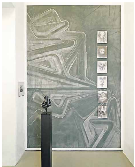
Geschichtet. Blick in die Ausstellung der Galerie Semjon Contemporary.

Ausstellung wie Katalog sind kleine, kluge Exkurse über die Möglichkeiten der Zeichnung geworden und lassen kaum etwas aus. Papier wird mit Buntstiften gefärbt und mit der Schere traktiert,