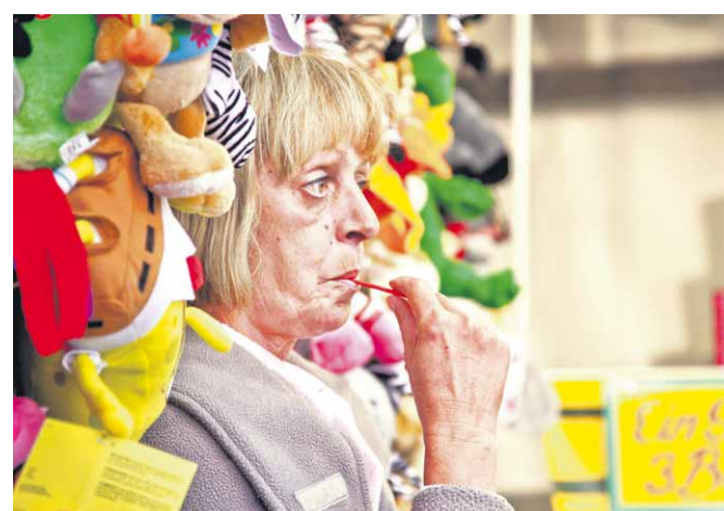
Kurze Pause. Auf dem Münchner Oktoberfest ist dieses Bild einer Schauspielerin entstanden.