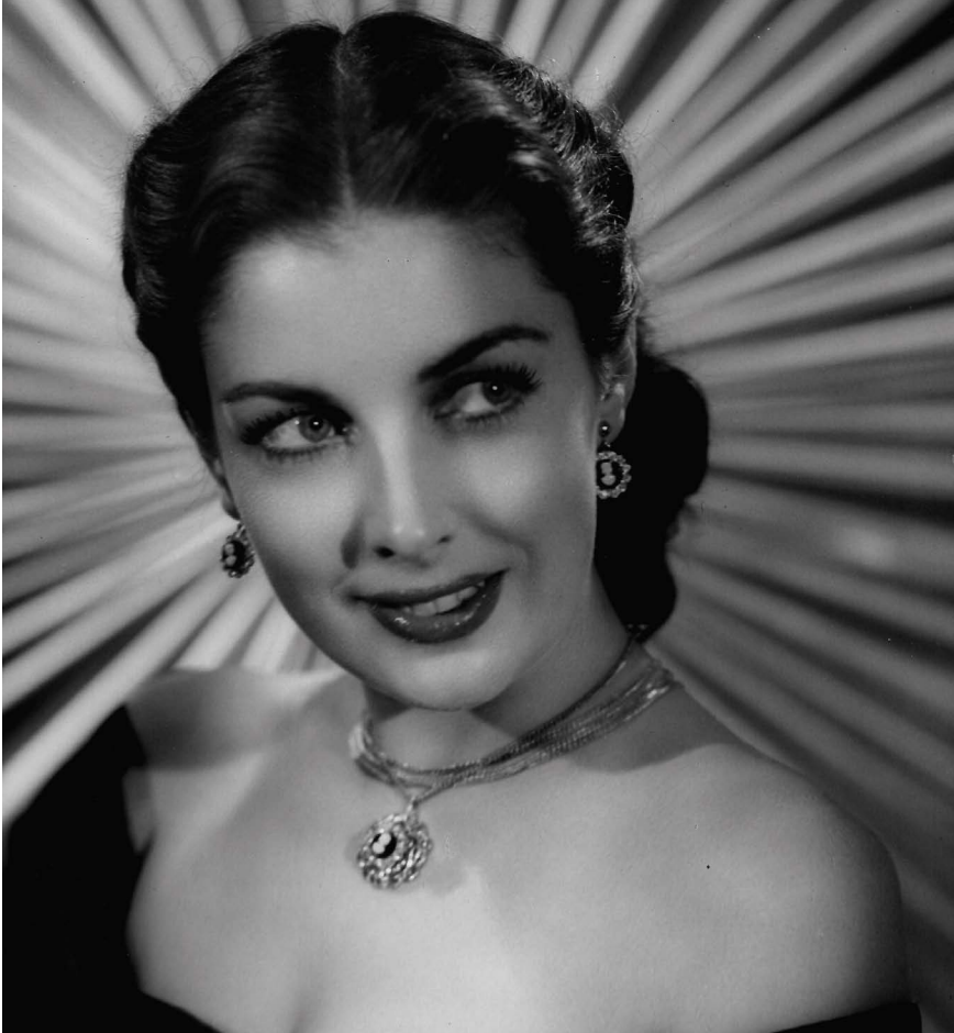
Oben: Unbekannte Schauspielerin der 1950er-Jahre Unten: Die Stripperin Lili St. Cyr (1918 bis 1999)