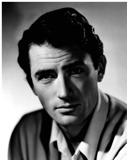
Links: Forrest Tucker (1919 bis 1986) wurde vor allem als Westernheld berühmt. Rechts: Der legendäre Gregory Peck (Moby Dick, Die Kanonen von Navarone, Arabeske) starb 2003.