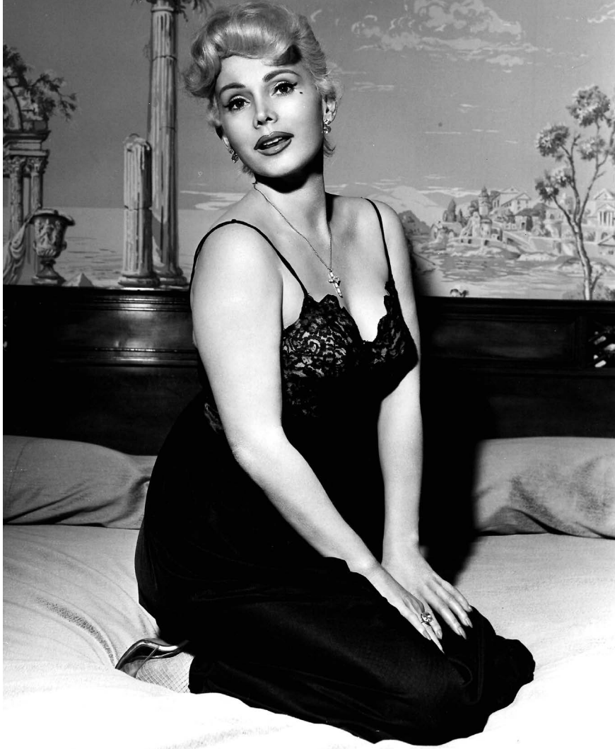
Oben: Zsa Zsa Gabor, 1958. Neben dem Film Moulin Rouge von 1952 erregte sie vor allem durch ihr turbulentes Privatleben einiges Aufsehen.