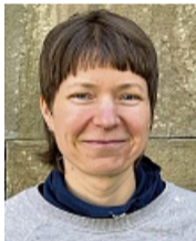
Luise Ritter Künstlerin

Die Bilder sind menschenleer, wie die Fotografien von Sibylle Bergemann (1941–2010) zu den Häuserblocks in Berlin-Lichtenberg. Die Fotokünstlerin hatte schon zu DDR-Zeiten einen Namen. Sie ist Mitbegründerin der Fotoagentur Ostkreuz 1990 in Berlin. In Schwarzweiß zeigt ihre Serie „P2“, wie das Esszimmer im Plattenbau (neben der Küche mit Durchreiche) tatsächlich genutzt wurde: Sofa-