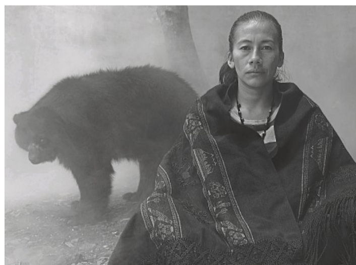
Die Fotografie „Ruth and Ajayu, 2022, Bolivien“ aus der Serie „The Day May Break“ von Nick Brandt.

Die Fotografie aus der Serie „The Day May Break“ ist in der Städtischen Galerie Iserlohn zu sehen. Der 1966 in London geborene Künstler kam 1995 nach Tansania. Er arbeitete dort am Musikvideo zu Michael Jacksons „Earth Song“ mit. Und er war fasziniert von der Schönheit der wilden Tiere. Aus diesem Impuls heraus begann er, Wildtiere zu fotografieren. Dabei versuchte er, ihnen möglichst nah zu kommen, Porträts zu schaffen, was seiner Ansicht nach mit dem Teleobjektiv und Distanz unmöglich ist. 2020 be-